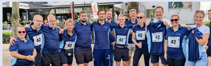
Från litet till medelstort företag på fem år. I augusti kraftsamlade hela gänget på Labotek Nordic i Stafettmaran Simrishamn-Ystad.

– Vi vill bygga lite som man behöver bygga i framtiden. Vår nya anläggning som vi flyttar in i under nästa år kommer att vara lite som ett skyltfönster och tillsammans med Skurups kommun – den fjärde mest växande kommunen i hela landet – etablerar vi ett helt nytt industriområde.